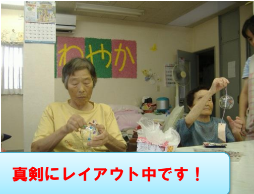
真剣にレイアウト中です！