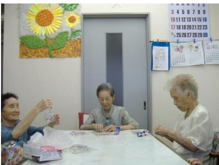
おしゃべりしながら楽しく作成♡

ケアマネさんより 金魚を頂き飼育を 始めました！ 大きく育つと良いなあ と話しています！